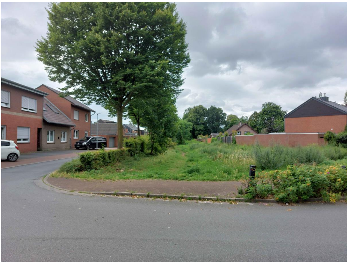
Abbildung 6: Blick auf die Trasse in Ortslage Bocholt